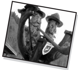
Wandern im Schnee