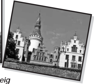
Eine Woche auf dem Rheinsteig