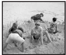
Ein Wochenende mit Kindern und Enkeln